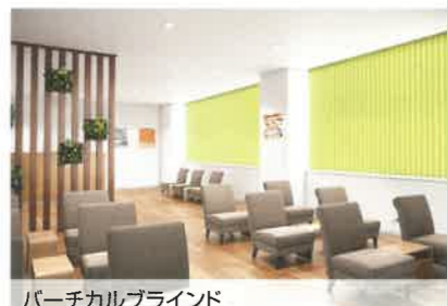
パーチカルブラインド V-1095 フレッシュグリーン