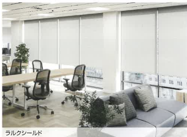
ラルクシールド RS-8863 グレー