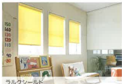
ラルクシールド RS-8350 イエロー