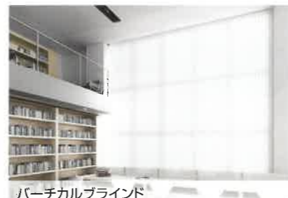
パーチカルブラインド V-1202 ライトグレー