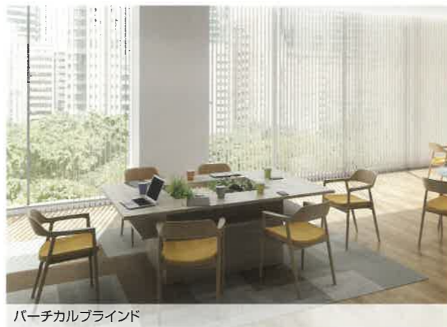
パーチカルブラインド V-1204 グレージュ