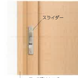
ロック受けカマチ