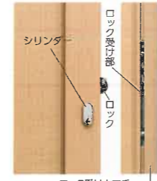
ロック受けカマチ